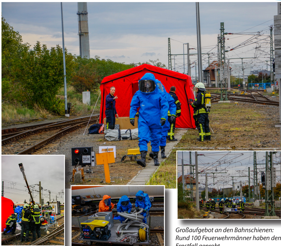
Großaufgebot an den Bahnschienen: Rund 100 Feuerwehrmänner haben den Ernstfall geprobt..